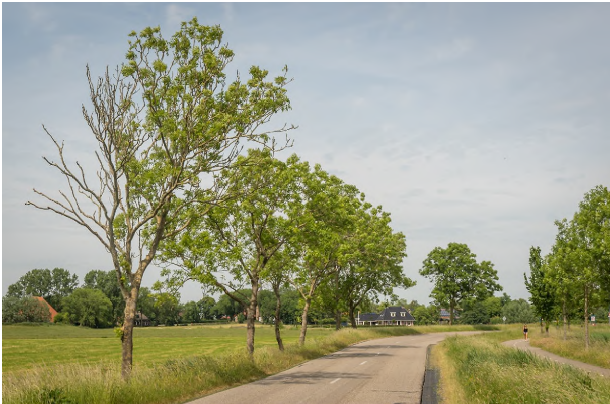
Essentaksterft >50% aangetast.