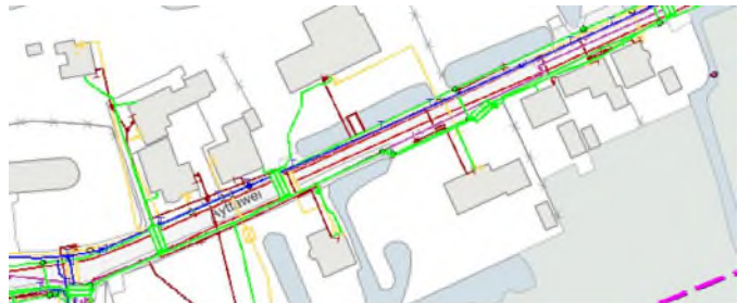
Ayttawei, Kabels en leidingen